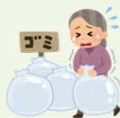
重いものが運べない