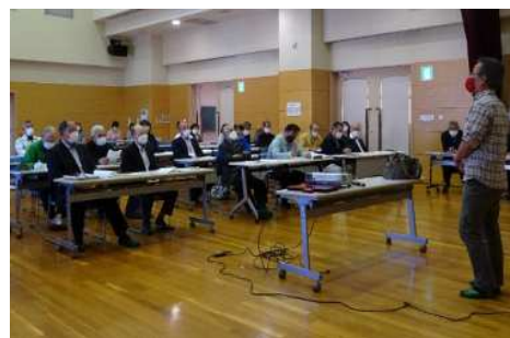
地域づくり講演会