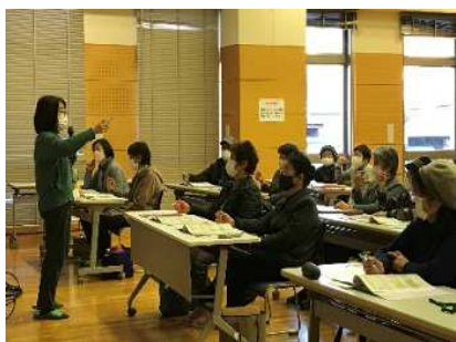
介護予防サポーター養成講座