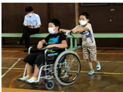
小中学校福祉教育