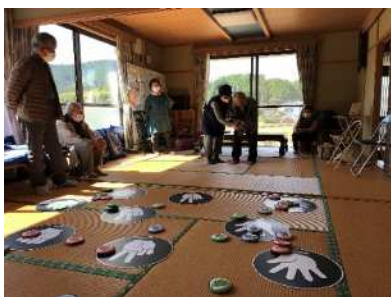
サロン活動の推進