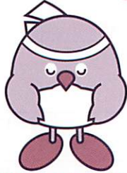
おおいた国体マスコットキャラクター「めじろん」