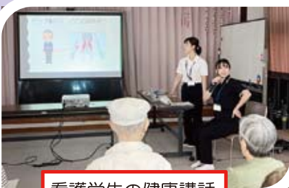
看護学生の健康講話