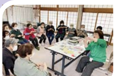
ハンドクリーム作り&マッサージ

①毎週水曜日 10:00～11:30 ②毎週金曜日 10:00～11:30 (水曜か金曜どちらかの参加となります)