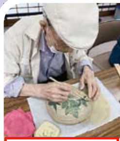
本格的な陶芸教室