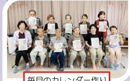
毎月のカレンダー作り