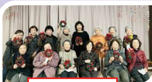
クリスマスリース作り

脳トレやめじろん体操など、楽しい行事で盛りだくさん♪ 町内在住で65歳以上の方なら、 どなたでも参加できます！