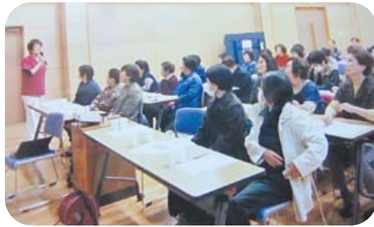
麻生歯科衛生士による口腔ケア