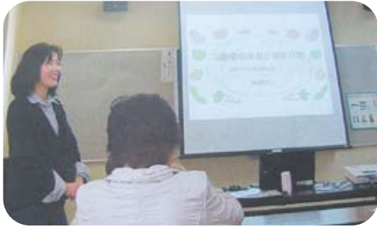
濱田管理栄養士による栄養講座