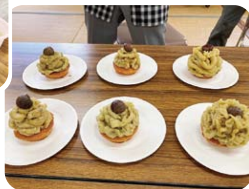
おやつレク (モンブラン風)