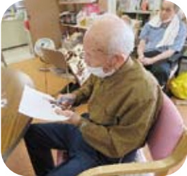
ハサミ使い上手です。