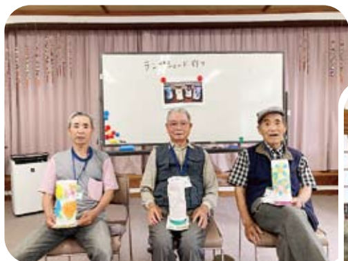
ランプシェード作り