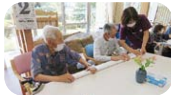
手先の器用さにビックリ！ 上手にできました。